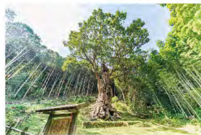
【武雄神社の大楠】 樹齢3000年 根回り26m/高さ27m/ 根元の空洞の広さは12畳敷。平成元年の環境庁の調査では、全国で6位の巨木。

まだまだコロナは収束しませんが、店内はお客様に安心してご遊技して頂けるように消毒清掃や換気強化等のウイルス対策は継続して取り組んでおります。ご来店時はお手数ですが、マスクの着用・手指消毒のご協力をよろしくお願いします。