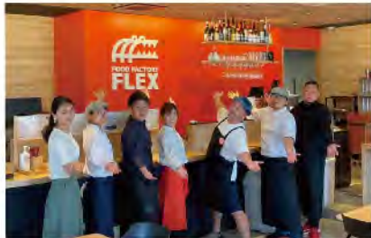
FLEX5店舗のそれぞれのおススメ料理とインク専門店「よかいる」のインクの数々 左上:お店はJR佐賀駅バスセンター前の市役所通りにあります 左下:FLEXを盛り上げる個性的なスタッフの面々