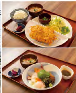
住 佐賀市高木瀬町1176-3 ☎0952-30-7007 🕒11:00 ~ 15:00 / 17:00 ~ 21:30 📅休なし

昨年9月にオープンした「定食 馬乃米(うまのこめ)」は店名の通りに定食を中心とした和食レストラン。米・調理・魚・醤油・価格と五つにこだわりを持ち、定食のメニューも約15種類。人気No.1は「マグロカツ定食 ¥900(税込)」。料理長からのおススメは「本日の煮魚定食 ¥930(税込)」と「海鮮丼 ¥1000(税込)」。和食を中心としながらも「有明チャンポン ¥650(税込)」や「ホウレン草エッグ・焼チーズカレー ¥500(税込)」のメニューもあります。