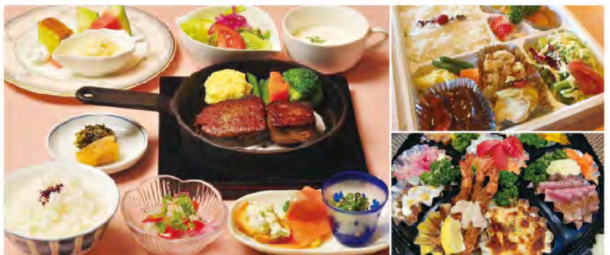
住 佐賀市高木瀬町大字長瀬982-8 ☎0952-33-1070 🕒11:30 ~ 15:00 / 17:00 ~ 21:00 📅休不定休

40年以上の歴史を誇る創作フレンチの「ビストロ藤吉」はゆったりと寛げる雰囲気のレストラン。ランチメニューは日替わり、プチコース、ハンバーグセット、レディース膳などがあり、それぞれのメニューが肉料理と魚料理の組み合わせとボリュームに違いがあるので、貴方のお腹の空き具合でお選びください。昨年からはテイクアウトのお弁当や、予算に応じてオリジナル弁当、オードブル盛り合わせの販売も始めています!