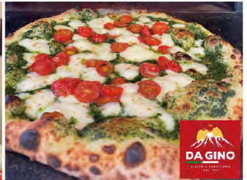
住 佐賀市神野東3丁目7-13 ☎0952-30-8955 🕒ランチ11:00 ~ 15:00 / ディナー 18:00 ~ 22:00 📅休月曜日