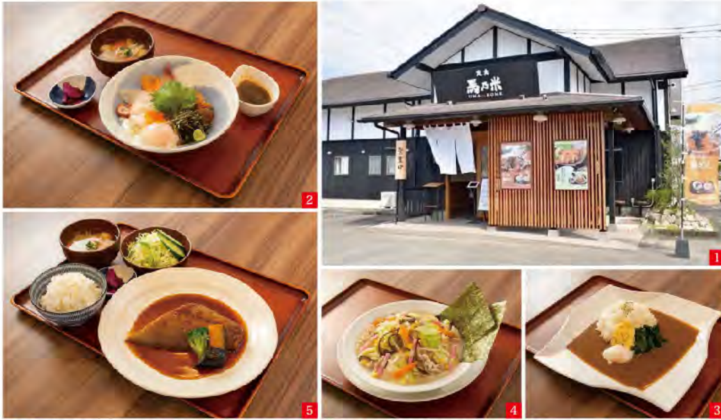
1 馬乃米佐賀大和店の店舗外観 2 新鮮な海鮮を堪能出来る本格海鮮丼 3 いけます! ほうれん草エッグ・焼きチーズカレー 4 しっかりコクのある出汁とたっぷり具材の有明チャンポン 5 和食料理人が作る煮魚定食は別格の美味しさです