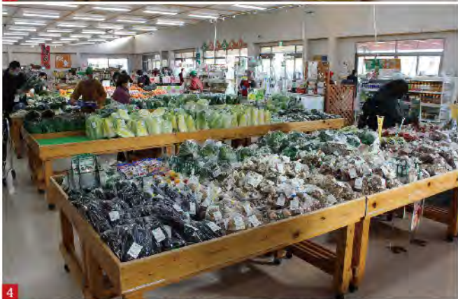
3 4 開店から朝採れの新鮮な野菜類が整然と並びます