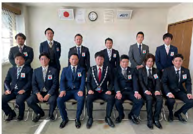
2022 年度理事メンバー

2022 年度筑後青年会議所は 「行動あるのみ～ Just Do It!! ～」 をスローガンに掲げ邁進してまいります！