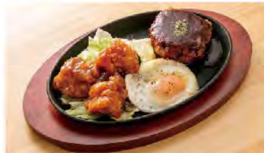
上:人気の牛サガリ鉄板 下:ハンバーグと唐揚げが楽しめるハンバーグ&ジャポカラ (¥1,200)