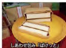
しあわせ包み「ぼけつと」

お子様からお年寄りまで人気の「ひだまり焼きドーナツ」は油で揚げていないためとってもヘルシーな商品です。完売必須のぼた餅は大好評をいただいています。おひとつからでもご予約できますのでお気軽にお電話ください。船小屋の美味しいお菓子と一緒にくつろぎの時間をお楽しみ下さい♪