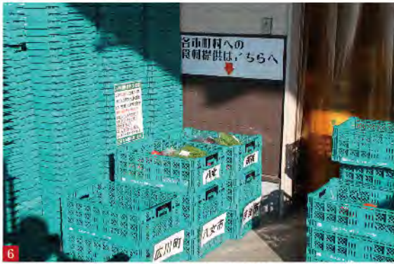
6 前日に売れ残って引き取られない野菜はコンテナに入れられ、各社協が引き取りに来られます

行っています。そして午後4時から6時の間に社協の入口にテーブルを置き、その上に野菜を並べています。筑後市社協では、以前から「ひとり親家庭を応援！」という形でご寄付をいただいたお米やインスタント食品、缶詰、お菓子などの無料配布を時期や対象者を決めて行っていました。 よらん野からいただいた野菜の配付事業は「グリーンフードパントリー事業」と銘打って昨年の10月18日からスタートしています。