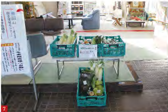
7 筑後社協の入口に並べられた色々な野菜はひとり親家庭の方達の食卓に並びます

また、入口に野菜を並べているので来館された方が「この野菜はどうするの？」と職員に尋ねられ「ひとり親家庭に配付します」と答えると、その後は、直接野菜を社協に持って来られて「うちで作った野菜です。ひとり親家庭に使ってもらって下さい」と置いていかれるようになりました。今後もよらん野や地元の家社企業などと手を携えて色々な事業が出来れば良いと考えています。