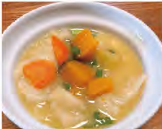
本熟米味噌と沢山の野菜で作った だんご汁