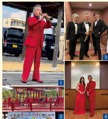
1 樟の香りコンサート9周年 2 水田天満宮 恋のかけはし 渡り初め 奉納演奏 3 筑後商工会議所女性部会 40周年 樋口軒にて 4 クリスマスライブ 日若屋にて

お客様は、下関市4 福岡市1 佐賀県5 大牟田市3 久留米市2 春日市1 みやま市1 そして筑後市4名の合計21名さまでした。ご来場のみなさんありがとうございました。