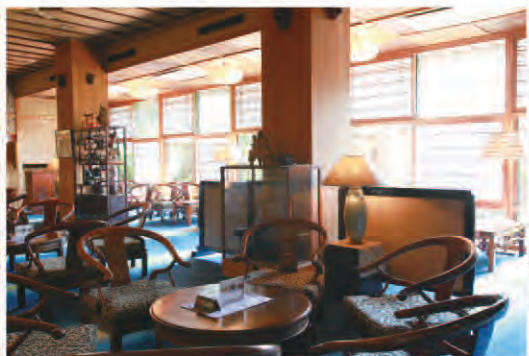
落ち着いた雰囲気のリビーは150年の歴史を感じます