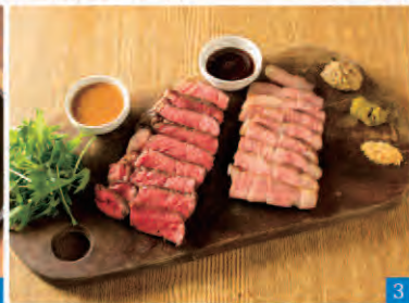
1 西鉄二日市駅西口から徒歩一分「下町ビストロ ロヂウラ」 2 イケメンスタッフが元気よくお出迎えます! 3 迷ったらオーロラアンガスビーフと糸島豚肩ロースの肉盛り!! 4 ニンニクの香りとプリプリのエビが食欲をそそるガーリックシュリンプ 5 いるどりも綺麗な人気のサワー各種