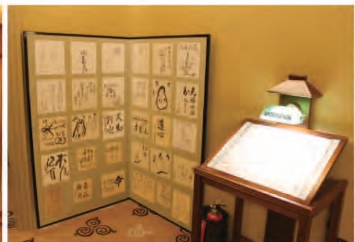
芸能人、著名人のサインが館内各所に飾られています