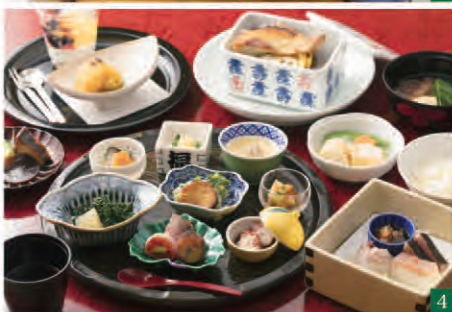
1 平安亭の「和」の中に「洋」を融合させた一部屋 2 お食事用の別室ではゆっくりと食事を楽しめます 3 平安亭には部屋ごとに内風呂があり好きな時に温泉を楽しめ 4 四季折々の食材を使った料理は器の美しさと一緒に!

日でのご利用、家族旅行、また接待の利用もあります。ほかに結納から結婚式、披露宴まで承っておりますが現在はホテルやハウスイエディングなど様々なスタイルがあるので結婚式関連では結納の食事会をご利用されるお客様が多いですね。 ―お客様へのおもてなし等で大丸別荘が特にこだわっている所はありますか？