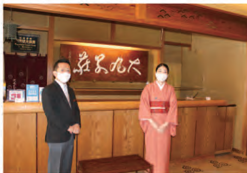
コロナ対策も万全にお客様をお出迎えいたします