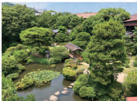
回遊式庭園では四季の移ろいを感じる事が出来ます