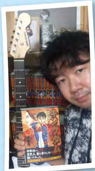
佐賀県三養基郡出身の原泰久が描いた『キングダム』私のバイブルです。