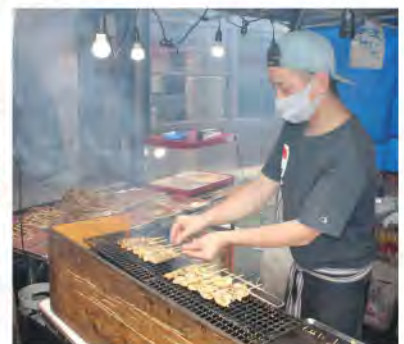
本格的な焼き鳥の味が一本¥100で味わえます。一本一本丁寧に焼き上げるフードハウスのスタッフ。