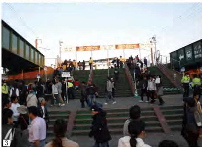
1 2 佐賀平野に悠然と舞い上がる巨大パルーンの数々 3 JR九州の協力で特別に開設されたパルーンさが駅