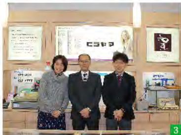
1 大いに盛り上がる大賀酒造の蔵開き 2 日本の着物の未来を創出する谷呉服店の皆さん。3 確かな技術ときめ細かな接客が人気のヒラヤマ。