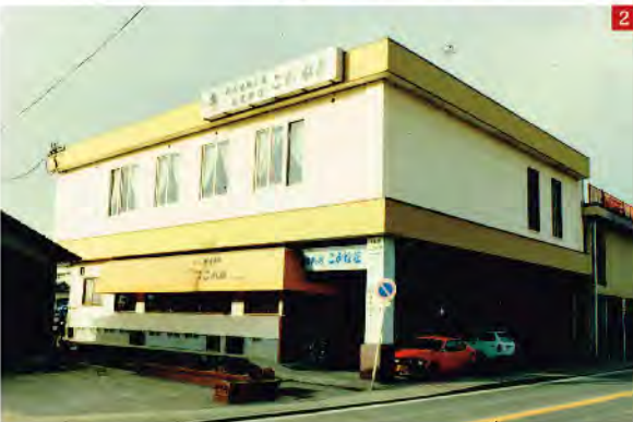
1 昭和48年 南側新館地鎮祭の儀式の写真。スーツ姿の父(洋右)が羽織袴の祖父(泰吉)を支えている。2 南側新館の完成写真。新館右側は当時の入り口玄関。