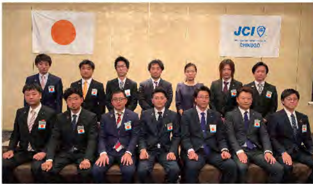
2020年度・理事メンバー