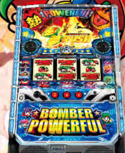
SLOT ボンバーパワフル3