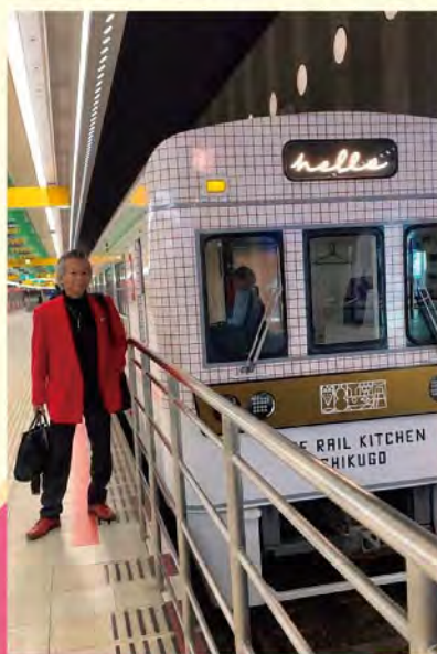
12月13日金曜日 演奏を終えた天神終点にて

沿線音楽家 in TRKC このタウンマガジンが出る時は1クール終わった時ですが、また2クール目のお声がかかるのが楽しみです。