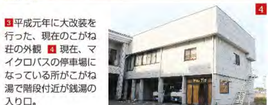
3 平成元年に大改装を行った、現在のこがね荘の外観 4 現在、マイクログバスの停車場になっている所がこがね湯で階段付近が銭湯の入り口。

ていた頃、男が一度はやってみたいことの一つにあった「番台に座る」ことをやられた訳ですね(笑)