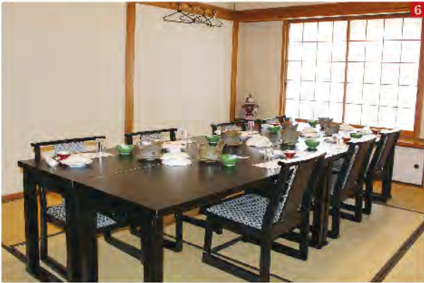
5 結婚式で賑わった2階式場。今でもパーティーなどで利用している。 6 2階の和室は、10人～50人収容の部屋も完備している。