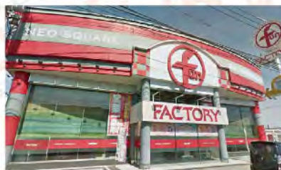
ファン ファクトリー 栄八女店