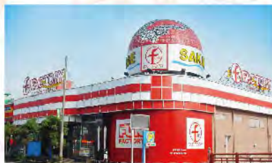
ファン ファクトリー 太宰府栄店