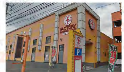
ファン ファクトリー 栄周船寺店