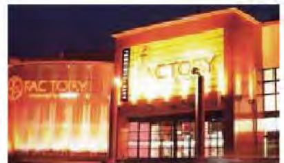
ファン ファクトリー 栄筑紫野店