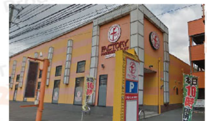
ファン ファクトリー 栄周船寺店