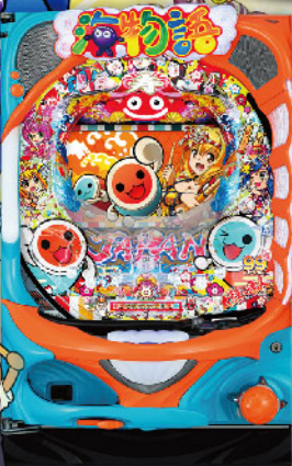
4円 パチンコ PA スーパー海物語 in JAPAN2 with 太鼓の達人