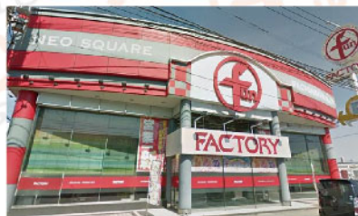
ファン ファクトリー 栄八女店