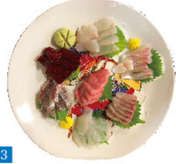
1 店舗前「さかなくらぶ」の看板の前でニコリの女将の知美さん 2 九州場所に時に来店された東関部屋の力士。現在は親方になられた高見盛関も来店されました。 3 4 女将さん撮影の刺身の七種盛合せ(右)とアラの刺身盛(左) 5 本日のおススメの刺身や焼き魚、煮付けが黒板に書き込まれています。