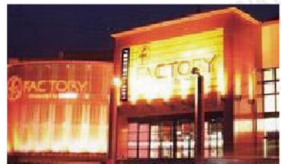
ファン ファクトリー 栄筑紫野店