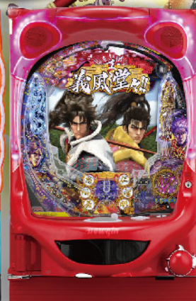
4円 パチンコ P義風堂々!! ~兼続と慶次~ 2