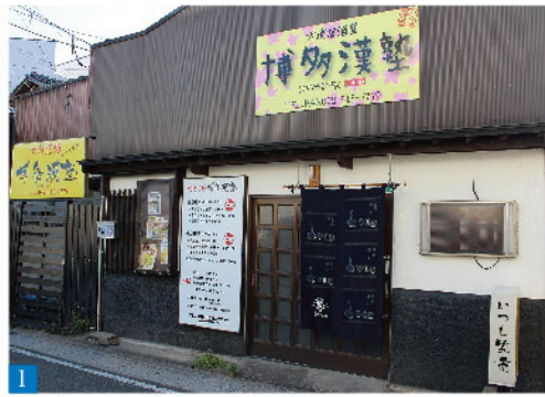
1 博多漢塾の店舗外観 2 いつも笑顔の珠希ママ 3 特製の唐揚げの味とボリュームは折り紙付き 4 人気のニンニクが効いた手作り餃子 5 炭火でジックリ焼き上げた焼鳥も好評です。