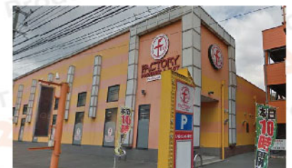
ファン ファクトリー 栄周船寺店