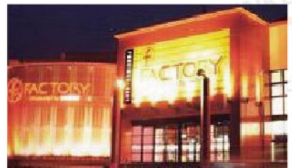
ファン ファクトリー 栄筑紫野店