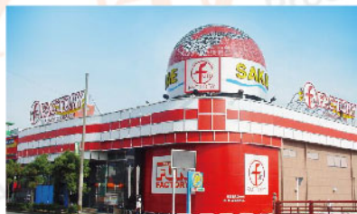
ファン ファクトリー 太宰府栄店