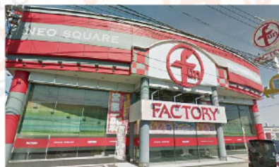
ファン ファクトリー 栄八女店