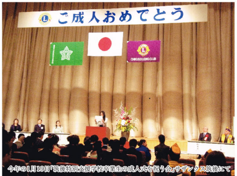
今年の1月19日「筑後特別支援学校卒業生の成人式を祝う会」サザンクス筑後にて

す。しかし年代を問わず、どのLCも抱えている問題だと思えますが、例会の出席率がなかなか上がらない事ですね。