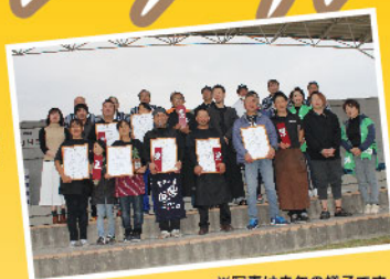
※写真は去年の様子です。

出展者を募集中です。筑後七国(八女市、筑後市、みやま市、柳川市、大川市、広川町、大木町)に店舗を構える飲食店より、30店舗程度の参加希望店舗を募集しています。グランプリは来場者の投票により、当日決定し表彰いたします。興味がある方は担当者までご連絡下さい。