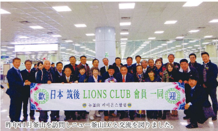
昨年11月釜山を訪問しニュー釜山LCと交流を図りました。

しては11月8日に筑後市内でウェルカムパーティーを開き、翌日は人吉で川下りと熊本城見学などの観光をして交流を更に深めていきたいと思っています。その他にも昨年は「献血」「ミュージックウオークラリー」「八女・黒木・筑後三クラブ合同例会」「鳥栖合同例会」「5クラブ親睦スポーツ大会」など多くの奉仕活動や例会を開催しました。