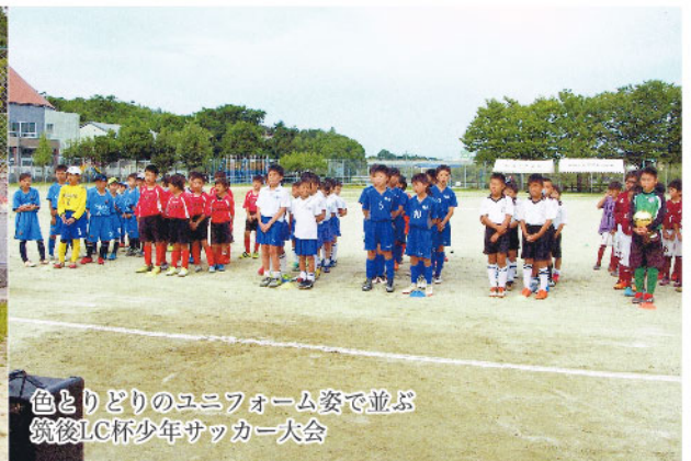
色とりどりのユニフォーム姿で並ぶ筑後LC杯少年サッカー大会