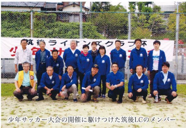
少年サッカー大会の開催に駆けつけた筑後LCのメンバー

イオンズクラブ杯少年サッカー大会」は23回目の開催になります。この大会には市内6チーム5年生以下の編成で71名の参加がありました。71名の選手の中には女の子の姿もありグラウンドを駆け回る姿がとても印象的でした。この他は今回で29回目を迎えた「筑後特別支援学校卒業生の成人式を祝う会」は年明けの1月19日に新成人32名、保護者・先生方・寄宿舎生の総勢240名が出席して盛大に取り行われました。この成人式を祝う会は18歳で特別支援学校を卒業した学生達を2年後に二十歳になった成人のお祝いとして開催しています。青少年の育成事業としてはこの三つですが、国際交流として韓国釜山市のニュー釜山ライオンズクラブとの交流も42年を数えます。一年おきに筑後と釜山を訪ねて交流を深めています。昨年は筑後LCが11月23日から25日までの3日間釜山を訪問しニュー釜山LCと交流を深めました。今年はニュー釜山LCから20名ほどが筑後に来られる予定になっています。現在、日韓両国は非常に難しい関係になっていますが、今回もお互いのクラブの交流が続く事を大変嬉しく思っています。計画と