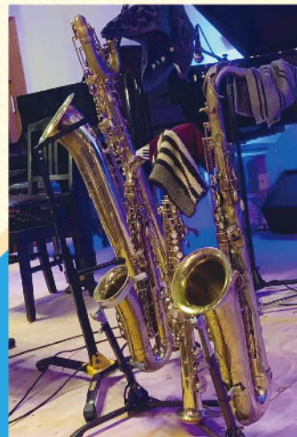
出番を待つ4本の楽器達 7月6日 旧古賀銀行 浪漫座 (佐賀市内)