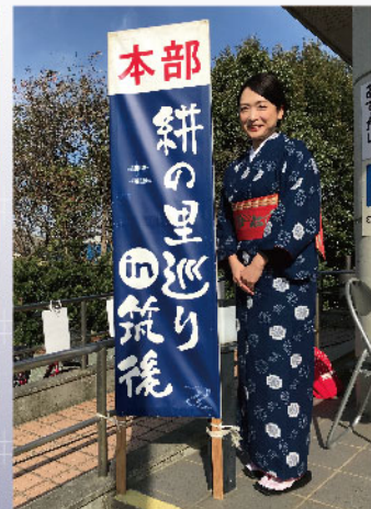
■絣着物で行く～のんびり・ゆるり～工房めぐり(イメージ)(予約のみ)

③「久留米絣を使ったヘアゴム作り体験(予約不要・100円で2個)」のほか、コーヒー等(100円～)の販売を行う(※2日(日)10:00～16:00