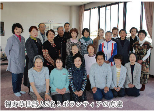
福寿草世話人8名とボランティアの方達