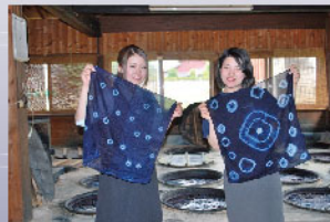
■藍染体験ができる工房もあります。

②<新規企画>ご来場者アンケートにご協力いただいた方の中から抽選で7名様に「絣製品・藍染製品」をプレゼント。(応募箱:本部 熊野区公民館)