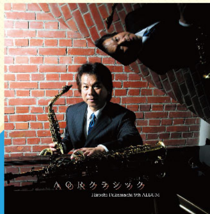
9枚目のアルバム AORクラシック