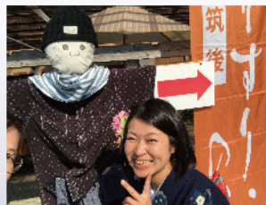
■絣かかし(かかしと一緒に写真を撮ろうフォトラリー)

①『かかしと一緒に写真を撮ろうフォトラリー』…各工房に設置されている、手作り絣かかし3体と一緒に写真を撮った方に絣の缶バッジプレゼント。(各日先着50名)