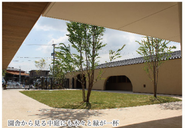
園舎から見る中庭にも木々と緑が一杯