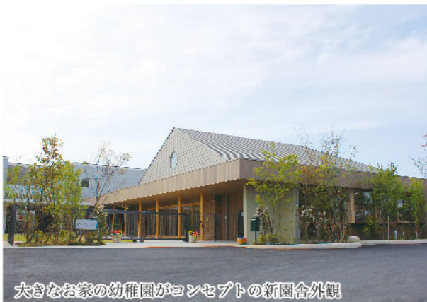
大きなお家の幼稚園がコンセプトの新園舎外観