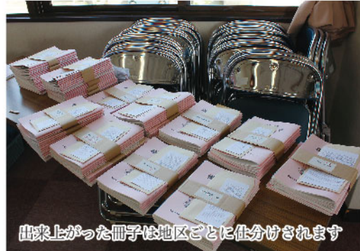
出来上がった冊子は地区ごとに仕分けされます