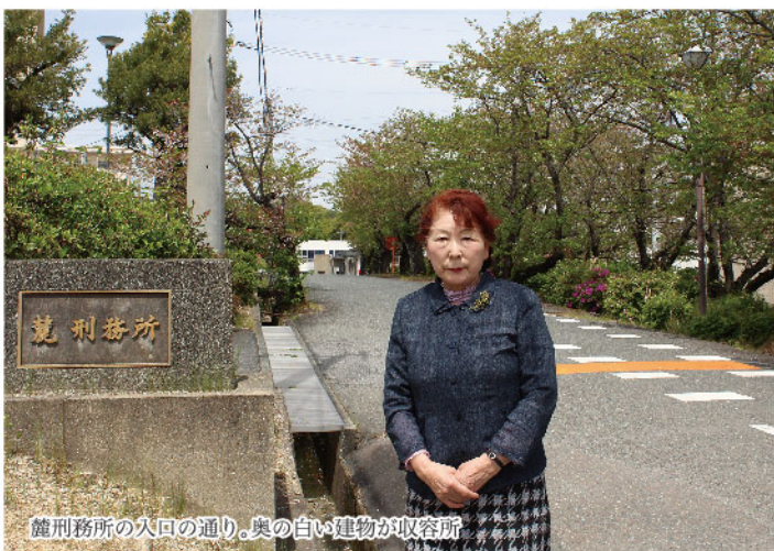
麓刑務所の入口の通り。奥の白い建物が収容所

世良田 私は2010年からは教誨師と篤志面接員も兼ねるようになりしました。受刑者は真面目に刑に服し模範囚として務めていると、刑の満期前に釈放されることとがあります。篤志面接員はその受刑者に釈放前指導を行います。受刑者には刑期が短い人も10年以上の人もいます。刑期の間に社会は凄いスピードで進化し変化しています。まずはその事について話をし、出所したらどのような生活していくか？どうしたいか？釈放される刑者数人と一緒に話し合います。何年か前の釈放前指導を行った時の事でした。二十歳くらいの若い女性が交通事故で二人の老人を轢いて死なせ