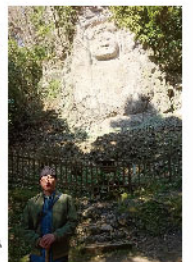
■右:磨崖仏「不動明王」の前で